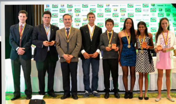
Los mejores juveniles de Colombia, de las categorías 12, 14 y 16 años.