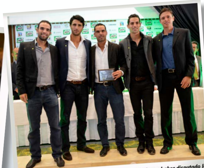
Reconocimiento al Equipo de Colombia de Copa Davis por haber disputado la final del Grupo I de la Zona Americana.