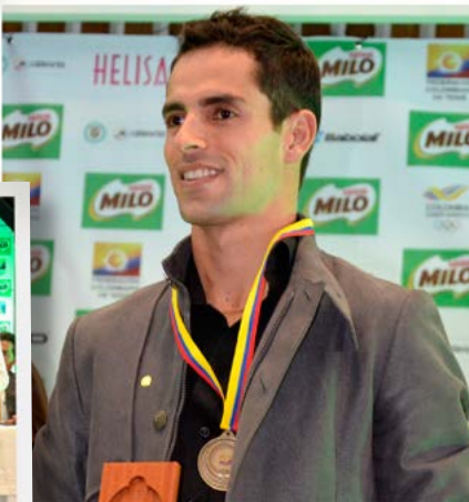
Santiago Giraldo, mejor jugador profesional de Colombia.